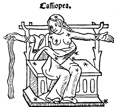
Рис. 3.10. Съзвездието Касиопея в книгата на Th. Radinus „Sideralis Abyssus“, 1551 г. Книгохранилището на Пулковската обсерватория (Санкт Петербург). Вж. също [543], с. 267, ил. 139.

В „Апокалипсис“ е казано: „А около престола имаше дъга, която наглед приличаше на смарагд“ (Ап. 4:3). Смарагдът е синкавозелен изумруд, а на всяка средновековна и съвременна карта ще видите и „дъгата“ около съзвездието на Трона: то винаги е потопено в бляскавата извивка на МЛЕЧНИЯ ПЪТ [1162], [1077], [1361].