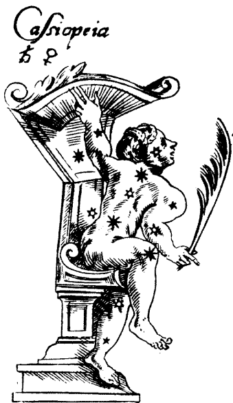
Рис. 3.8. Съзвездието Касиопея в старинна звездна карта. От [543], с. 70, ил. 30.