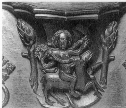
Рис. 7.29. Гола жена, яхнала елен – изображението е на кресло в църквата в Стратфорд-на-Ейвън. Уж от XV в. От [643:2], с. 212, ил. 3.