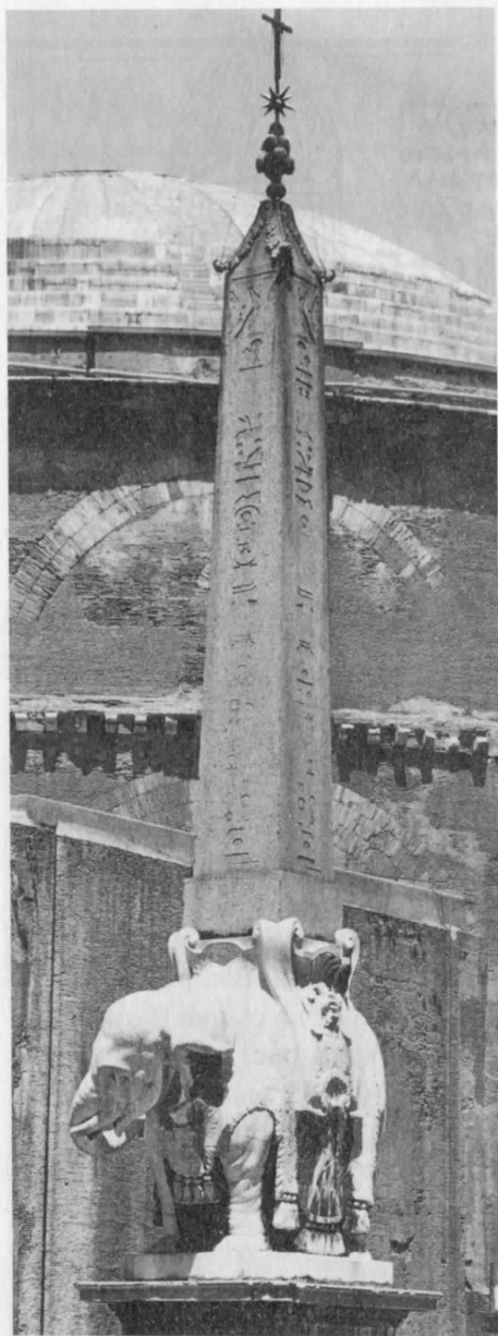
Рис. 7.81. „Древно“ египетски обелиск на площад „Минерва“ в Рим. На върха му има християнски кръст. От [1242], с. 43.