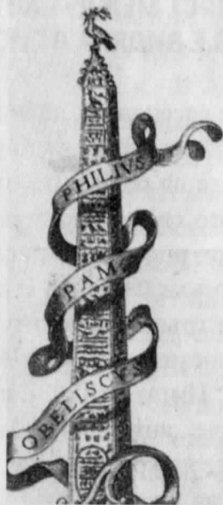
Рис. 7.88. Увеличено изображение на петел или гълъб върху „древно“-египетския обелиск на Памфилий. Петелът или гълъбът са християнски символи. От [1374], с. 119.

Казват ни всъщност, че тази книга е написана уж с научен стил, но съвременните историци знаят по-добре от средновековния автор какви са били „истинските египетски старини“. Затова нека да се отнесем към Франческо Колона снизходително и старателно да зачеркнем книгата от списъка с научна литература.